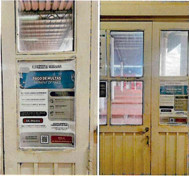
Puente San Roque González de Santacruz

Misión: Somos el ente rector y ejecutor de la Política Migratoria del Paraguay, responsable de la gestión de permanencia y el movimiento migratorio de connacionales y extranjeros, contribuyendo a la seguridad nacional, al desarrollo del país y al respeto de los derechos humanos.